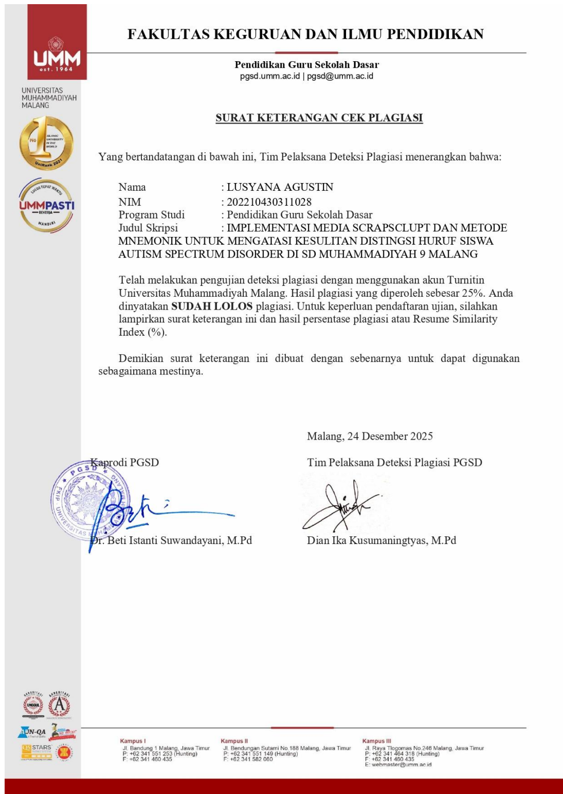
Gambar Lampiran 6.1 Surat Keterangan Lolos Plagiasi