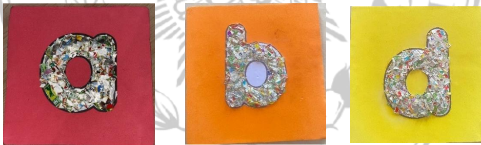
Gambar 2.1 Media ScrapSculpt

Pemanfaatan ScrapSculpt sebagai media pembelajaran memenuhi syarat sebagai media pembelajaran inovatif, karena ScrapSculpt dapat menjadikan peran siswa yang awalnya pasif menjadi aktif (Kurniasih, 2018). Hal ini sejalan dengan teori belajar konstruktivisme, dipelopori oleh Jean Piaget dan Lev Vygotsky yang berpadangan bahwa pengetahuan tidak diperoleh secara pasif, tetapi dibangun secara aktif oleh individu melalui interaksi dengan lingkungannya (Masgumelar & Mustafa, 2021).