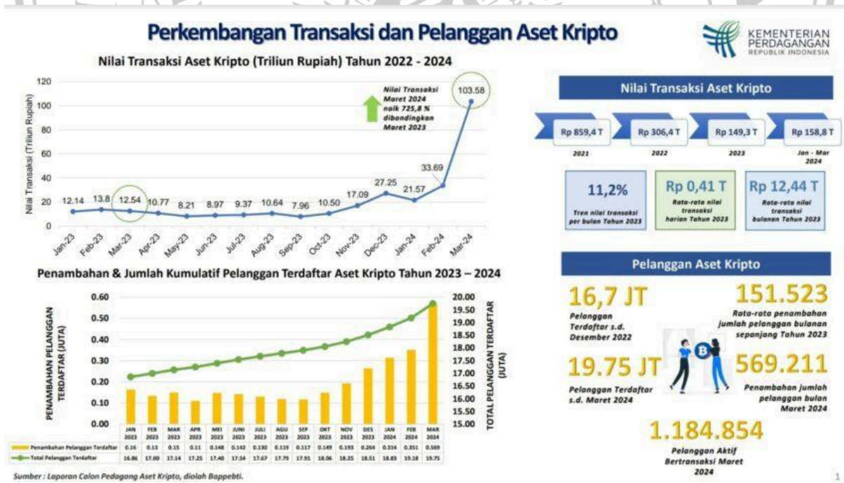
Gambar 1.2 Perkembangan Transaksi dan Pelanggan Aset Kripto

Perkembangan pesat dunia kripto di Indonesia menjadi salah satu fenomena paling mencolok dalam lanskap ekonomi digital beberapa tahun terakhir. Peningkatan literasi digital dan kemudahan akses terhadap platform perdagangan aset kripto membuat masyarakat semakin tertarik untuk berinvestasi dalam aset digital (Setyaningrum, 2025). Berdasarkan laporan Badan Pengawas Perdagangan Berjangka Komoditi (Bappebti), hingga Oktober 2024 tercatat sebanyak 21,63 juta pelanggan kripto terdaftar dengan nilai total transaksi mencapai Rp475,13 triliun selama periode Januari hingga Oktober 2024. Angka ini memperlihatkan peningkatan tajam sebesar 352,89% dibandingkan periode yang sama pada tahun sebelumnya yang hanya mencapai Rp104,91 triliun (Vritimes, 2024). Lonjakan ini tidak hanya menandakan meningkatnya kepercayaan publik terhadap aset kripto sebagai instrumen investasi alternatif, tetapi juga menunjukkan bagaimana dinamika ekonomi digital di Indonesia semakin berkembang dan mempengaruhi pola perilaku keuangan masyarakat. Perkembangan ini menegaskan bahwa kripto bukan lagi sekadar fenomena sementara, melainkan bagian dari transformasi ekonomi digital nasional yang melibatkan aspek teknologi, sosial, dan budaya investasi.