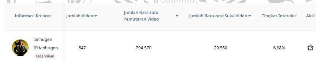
Gambar 1.2 FastMoss TikTok Analitik pada kreator konten Ian Hugen

Dalam ruang media sosial ini, muncul istilah influencer , yakni individu yang memiliki pengaruh kuat terhadap opini, lifestyle , dan perilaku pengikutnya melalui konten yang mereka buat secara konsisten. Komunikasi yang dilakukan dapat bersifat verbal dan non-verbal, tetapi seringkali disertai dengan foto, review , produk/properti pendukung, atau video yang dalam hal ini dapat berbeda-beda tergantung pada tiap segmen (Ring et al., 2016). Influencer seringkali menjadi figur utama dalam membentuk diskusi publik, termasuk di bidang sensitif dan kompleks seperti identitas gender. Beberapa Influencer kelompok minoritas transgender, mulai mendapatkan ruang untuk menyampaikan suara dan pengalaman mereka di tengah dominasi narasi heteronormatif.