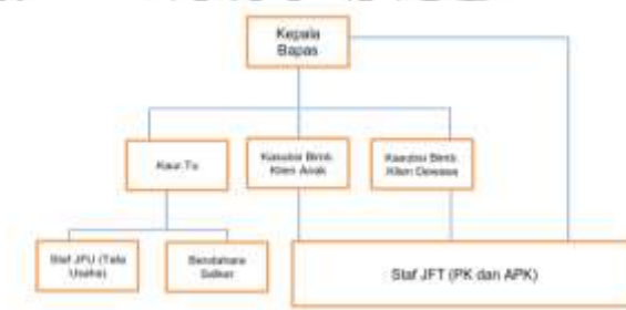
Gambar 1. Struktur Organisasi Balai Pemasyarakatan Kelas II Bojonegoro