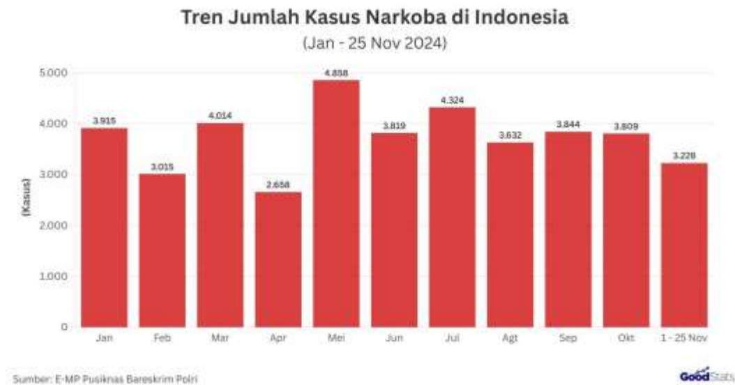
Gambar 2. Tren Jumlah Kasus Narkoba di Indonesia