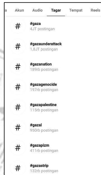
Gambar 1.2 Tagar Gaza di Instagram