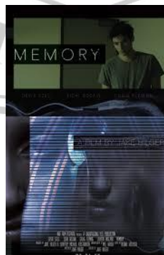
gambar 2. 2 Poster Memory

Seorang sutradara yang tengah merancang sebuah film tentu memerlukan berbagai rujukan visual untuk memperkaya gagasan awalnya. Referensi tersebut