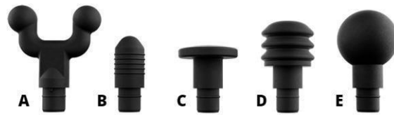
Gambar 2. 2 Tipe Perkusi (Cheatham et al. , 2021)

Pada modalitas tersebut ada 3 kategori kecepatan yaitu kecepatan rendah (rentang 17-29 Hz), sedang (rentang 33-40), dan kecepatan tinggi (rentang 47-53 Hz). Diplikasi pada otot hamstring selama 5 menit (memindahkan alat pijat secara longitudinal dalam garis lurus dari distal ke proksimal dan kembali ke distal dalam waktu 20 detik) (Cheatham et al. , 2021).