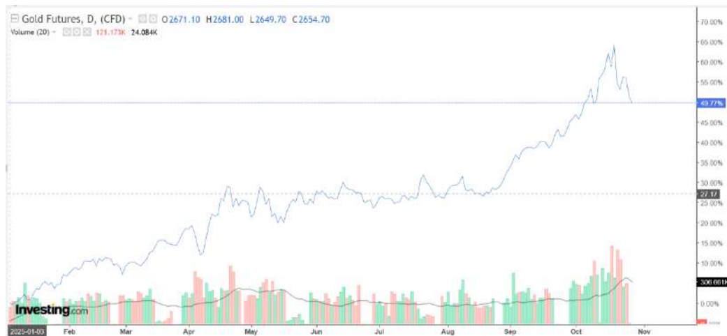
Gambar 1.2 Trend Investasi Emas Dalam Periode Bulanan