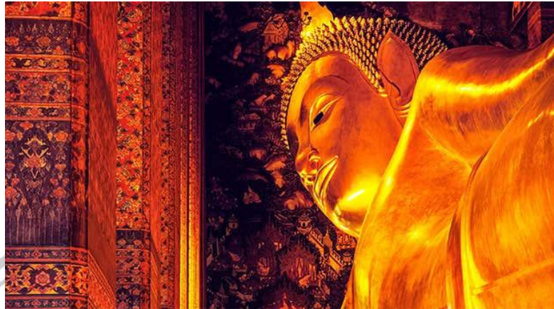
Gambar 2.12 Wat Pho