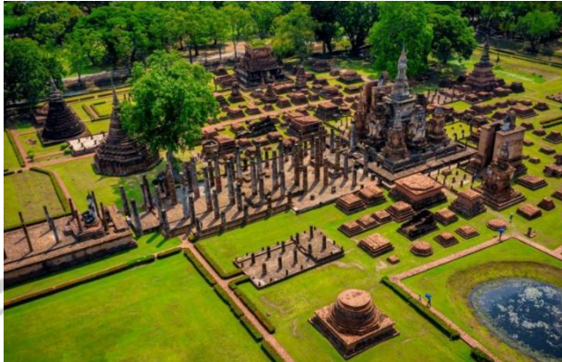
Gambar 2.9 Sukhothai Historical Park