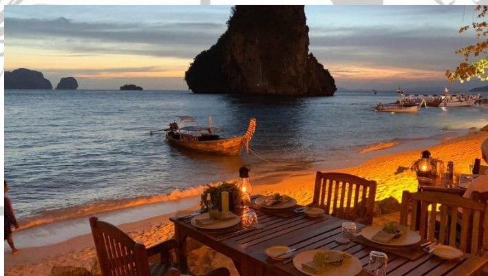
Gambar 2.2 Pantai Phra Nang