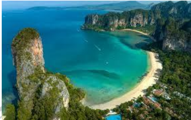
Gambar 2.1 Pantai Railay