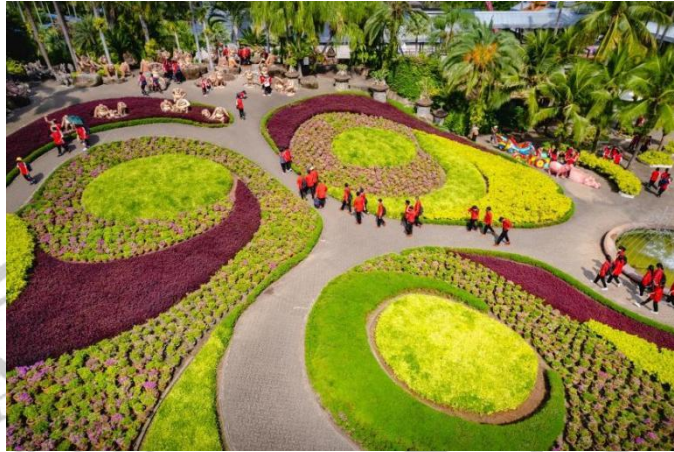
Gambar 2.6 Nong Nooch Tropical Garden