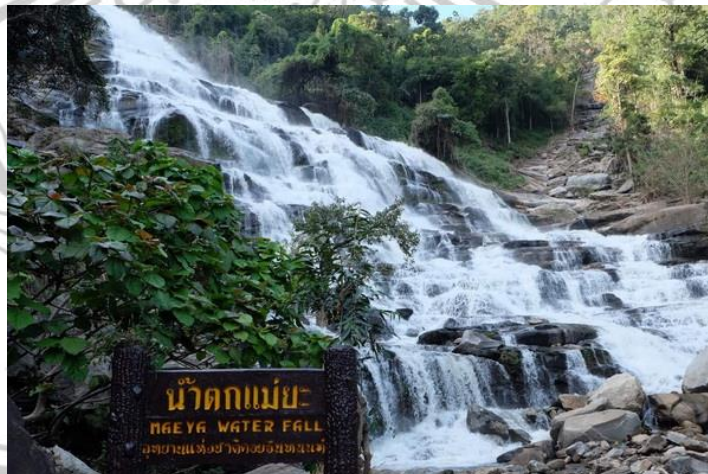
Gambar 2.5 Air Terjun Mae Ya