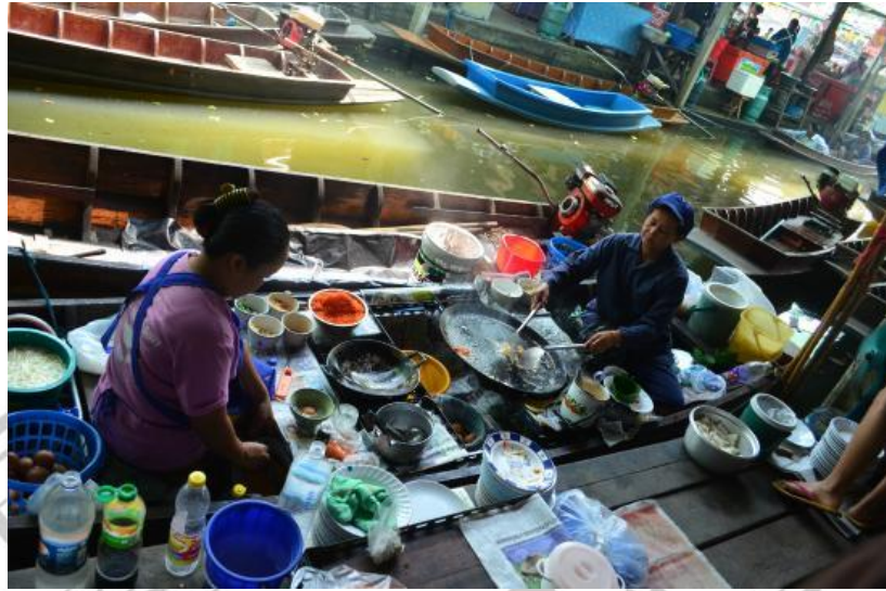
Gambar 2.19 Taling Chan Floating Market