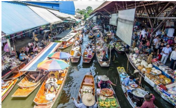
Gambar 2.18 Damnoen Saduak Floating Market