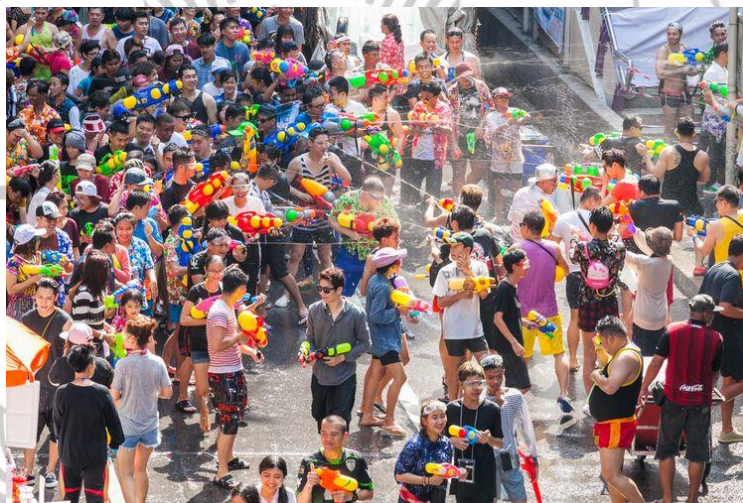
Gambar 2.7 Festival Songkran 2018