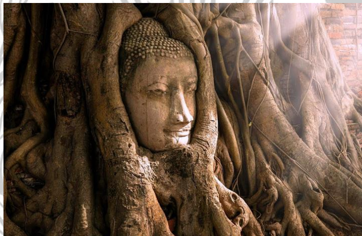
Gambar 2.10 Wat Mahathat