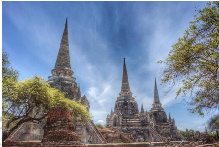
Gambar 2.11 Wat Phra Si Sanphet