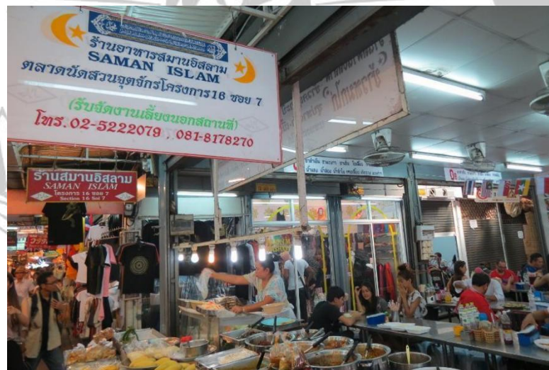
Gambar 2.14 Chatuchak Market