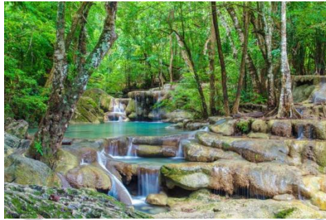
Gambar 2.3 Air Terjun Erawan