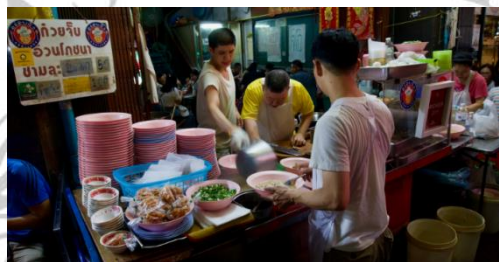
Gambar 2.13 Yaowarat

menciptakan pengalaman bersantap yang nyaman dan menyenangkan bagi para pengunjung. Dengan atmosfer yang mencerminkan budaya makanan yang sesuai dengan keyakinan mereka. Dengan meningkatnya minat terhadap kuliner halal, Saneeya Thai Muslim Food berkontribusi dalam memperkenalkan masakan Thailand kepada komunitas Muslim, sekaligus mendukung perkembangan industri pariwisata halal di negara tersebut. 45