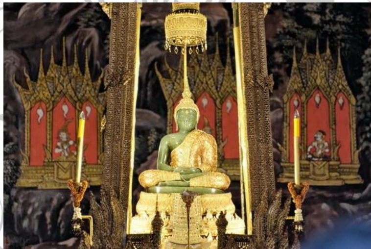
Gambar 2.12 Wat Phra Kaew

istana salju. Kuil ini dihiasi dengan cat warna putih bersih bukan hanya untuk menarik wisatawan internasional buat berkunjung ketempat ini tetapi karena warna ini dianggap sebagai simbol kehidupan dan kematian di dalam agama Buddha. Wat Phra That Doi Suthep berada di Chiang mai. Kuil ini sangat diminati wisatawan asing karena kuil ini terletak di puncak gunung Doi Suthep jadi bisa melihat pemandangan kota di Chiang Mai. Kuil ini dianggap tempat paling suci bagi umat buddha di Tailand Utara. Menuju tempat ini harus trekking dengan keindahan alam, nilai spritual dan juga udara sejuk dari pegunungan sekaligus.