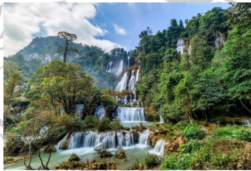
Gambar 2.4 Air Terjun Thi Lor Su