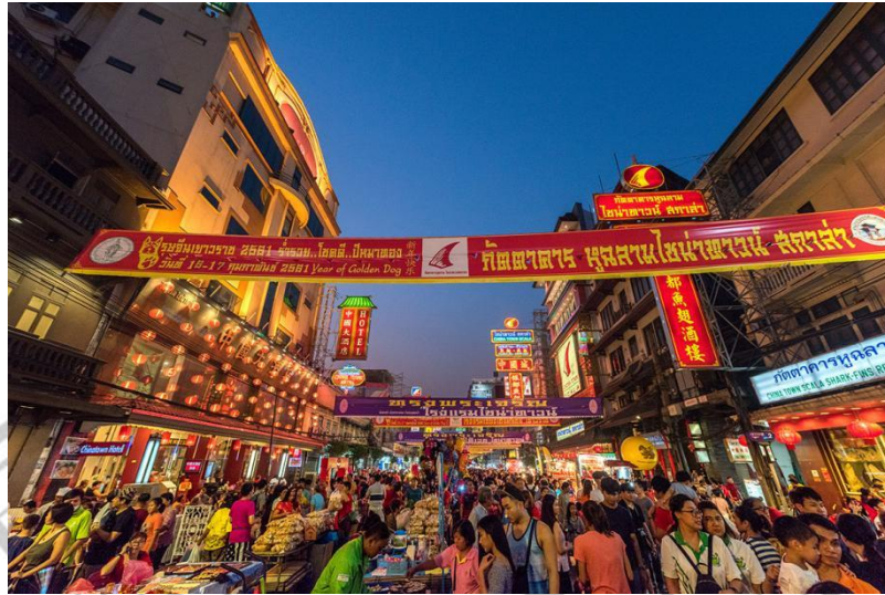
Gambar 2.15 Silom Walking Street