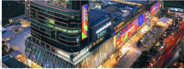
Gambar 2.17 Central World

dari Thailand. Wisatawan juga bisa naik ke perahu dan menyusuri kanal berinteraksi langsung dengan pedagang. Taling Chan Floating Market Bangkok pasar apung yang terkenal dengan memasak seafood segar diatas perahu.