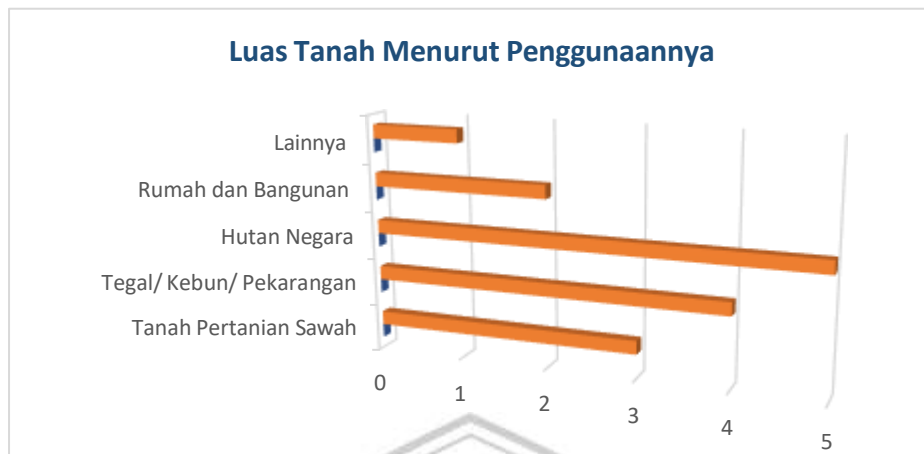
Gambar 1. 1 Diagram Luas Tanah Menurut Penggunaannya