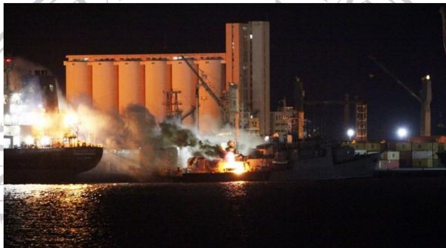
Gambar 2.4.1 Pelabuhan al-Khums

yang saat itu dikuasai kelompok pemberontak. NATO menyebut, serangan tersebut menjadi operasi terbesar terhadap armada laut Libya sejak aliansi itu ikut terlibat dalam konflik. Di Tripoli, bom menghantam pelabuhan utama hingga wartawan yang berada di sana bisa melihat api dan asap tebal membubung ke langit setelah kapal perang hancur. Selain Tripoli, sasaran lain adalah pelabuhan Khoms, yang terletak di antara Tripoli dan Misrata, serta pelabuhan Sirte di sebelah timur kota. 59