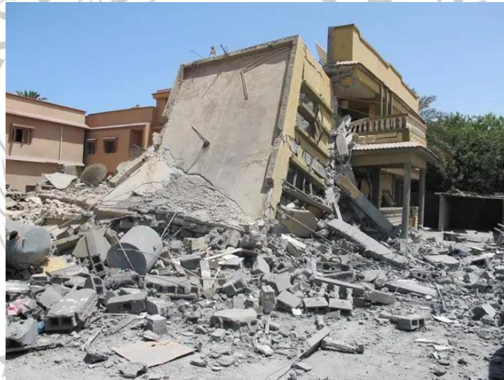
Gambar 2.2.7 Rumah Mustafa al-Morabit

menemukan tanda-tanda bahwa rumah tersebut digunakan oleh militer; al-Morabit dan tetangganya menyatakan bahwa rumah tersebut tidak digunakan untuk tujuan militer. Al-Morabit percaya bahwa sasaran yang dimaksud adalah rumah tetangganya, yang dia pikir pasukan Khadafi telah digunakan dan dikosongkan dua hari sebelum serangan. Meskipun tidak memberikan detail lebih lanjut, NATO beralasan menyatakan bahwa mereka telah menyerang "pusat komando dan kontrol". 47