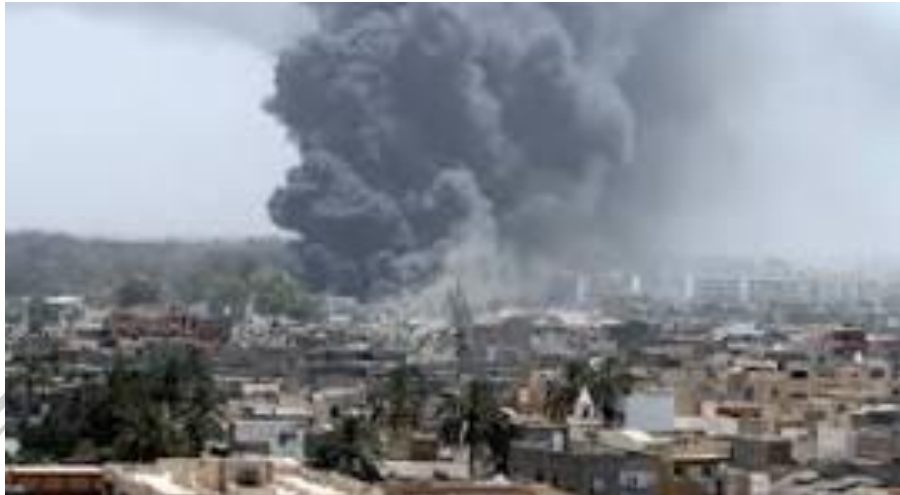
Gambar 2.4.2 serangan di Bab al-Aziziyah

bahwa korban sipil benar-benar terjadi. Kasus ini menjadi contoh nyata bagaimana rumah tinggal (sebagai sarana publik) turut menjadi korban dalam serangan.