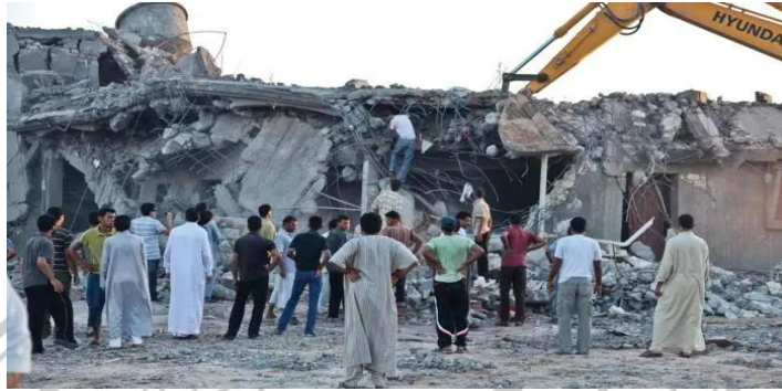
Gambar 2.2.3 Serangan di Majer

merupakan lokasi yang memiliki tujuan militer, sehingga Amnesty International juga memiliki kesimpulan yang sama dengan ICIL.