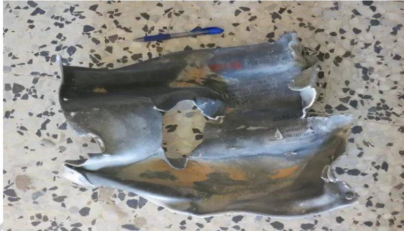
Gambar 2.2.2 Sisa amunisi MK82 Bomb