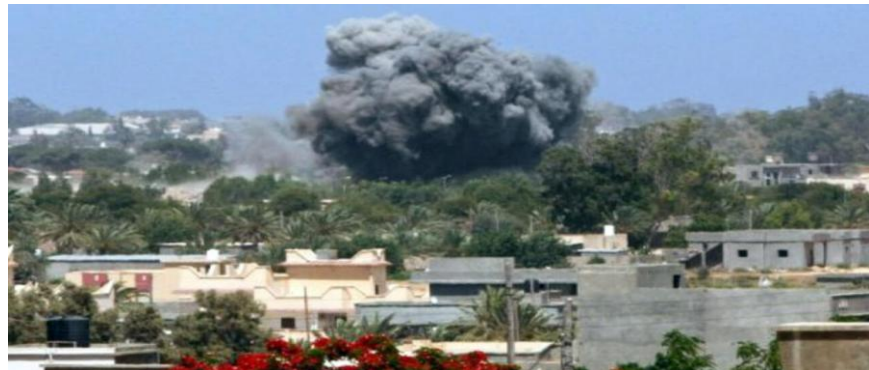
Gambar 2.2.6 Serangan NATO di Brega