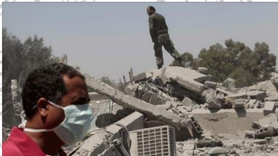
Gambar 2.2.5 Serangan NATO di Surman