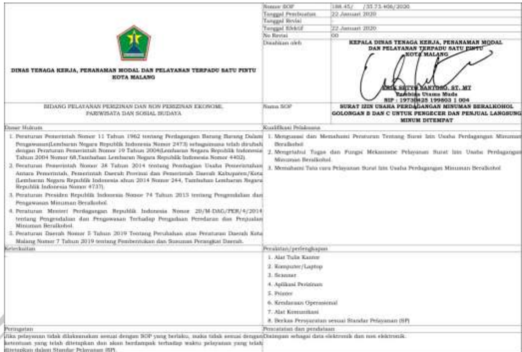
SOP : Surat Izin Usaha Perdagangan Minuman Beralkohol golongan B dan C untuk pengecep dan penjual langsung minum ditempat