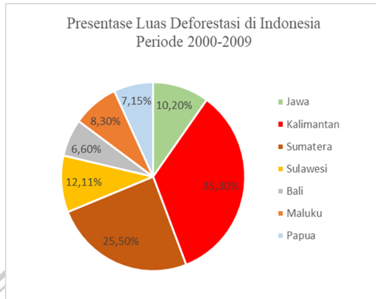
Gambar 2.2 Persentase Deforestasi di Indonesia Selama Periode 2000–2009