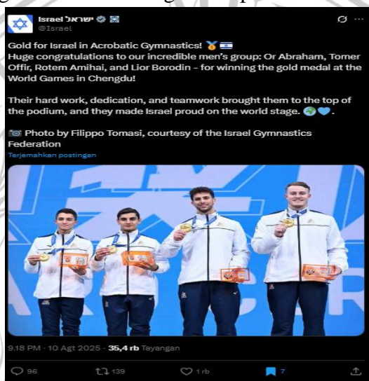
gambar 1. 1 Gambar Olimpiade emas Israel

Jadi berikut adalah beberapa contoh postingan dari Israel yang tidak di analisis dan tidak digunakan oleh sebagai data penelitian ini