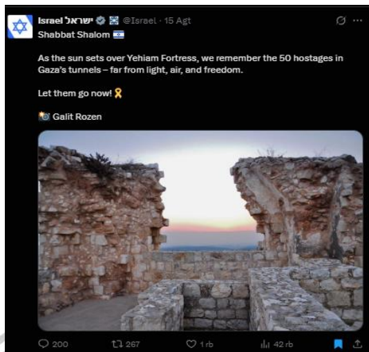
gambar 1. 2 Gambar photo Galit Rozen Israel

Postingan ini tidak memiliki analisis yang mendalam jika dibandingkan dengan 50 data yang telah dipilih. Isinya cukup sederhana dan sering kali mengulangi narasi sandera yang sudah sangat mendominasi dalam kumpulan data utama. Data yang menjadi fokus penelitian adalah postingan yang menawarkan lebih banyak kompleksitas, seperti yang disertai bukti visual, menyerang lembaga internasional, atau memuat kesaksian korban secara rinci.