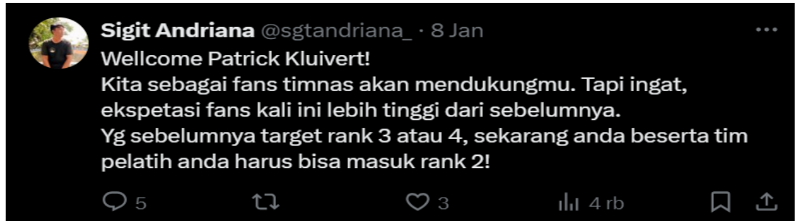
Gambar 1. 4 Komentar di akun X PSSI

Dalam peristiwa pemecatan Shin Tae-yong (STY), kelompok suporter seperti La Grande Indonesia menjadi subjek penting untuk dianalisis karena mereka tidak hanya berfungsi sebagai penonton, tetapi juga sebagai bagian dari audiens yang memiliki ikatan emosional, identitas bersama, dan loyalitas yang mendalam kepada tim nasional. Reaksi yang muncul dari kelompok ini dapat dilihat sebagai gambaran bagaimana suporter merundingkan pesan dari media dan membangun pemahaman mereka sendiri tentang kebijakan federasi. Beberapa anggota komunitas menunjukkan dukungan atas keputusan PSSI dengan alasan kebutuhan untuk menjaga profesionalisme manajemen tim dan pentingnya regenerasi dalam kepelatihan, sementara yang lain mengkritik dengan menyoroti waktu pemecatan yang dianggap kurang tepat serta dampak yang mungkin terjadi pada performa dan konsistensi tim di tingkat internasional. Disisi lain, terdapat juga orang-orang yang sangat menolak keputusan tersebut