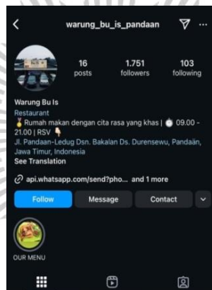
Gambar 1.1 : Akun Instagram Rumah Makan Bu Is

rumah makan ini secara aktif membagikan informasi menu, promo, serta aktivitas rumah makan. Keberadaan akun ini memudahkan konsumen untuk memperoleh informasi dan meningkatkan ketertarikan sebelum melakukan pembelian. Sebaliknya, informasi yang dikomunikasikan dari social media oleh pelanggan memengaruhi reputasi dan kredibilitas rumah makan Bu Is. Karena Konsumen sering bergantung pada ulasan orang lain tentang rumah makan sehingga dapat mempengaruhi keputusan pembelian (Kotler dan Keller, 2016). Penyebaran informasi dari Rumah Makan Bu Is dilakukan melalui media sosial seperti Tiktok dan Instagram. Berikut gambar dari media sosial Rumah Makan Bu Is sebagai strategi pemasaran yang dilakukannya. Dalam penelitian ini, instagram digunakan sebagai platform media sosial utama karena memiliki jangkauan dan interaksi tertinggi, dapat dilihat pada data insight instagram Rumah Makan Bu Is dibawah ini: