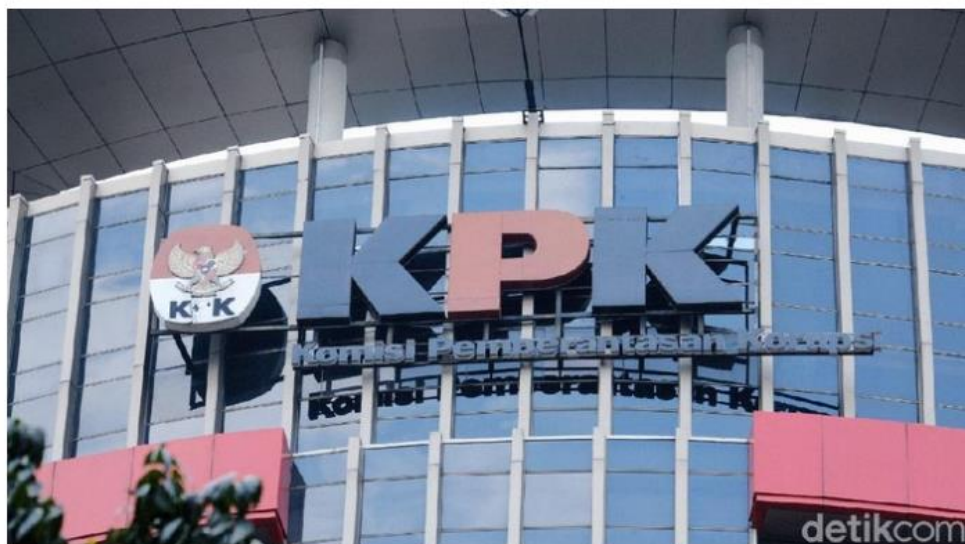
Gambar 2 Pemberitaan Prabowo-Gibran Menang Pilpres, KPK Yakin Bawa RI Maju Lebih Baik

Dalam pemberitaan kemenangan tersebut, media tidak hanya menyampaikan fakta atau hasil rekapitulasi suara, tetapi juga menyusun narasi, memberikan penekanan tertentu, serta menampilkan kutipan dan visual yang membentuk persepsi publik. Di sinilah analisis framing menjadi penting, karena framing dapat menunjukkan bagaimana media memilih, menonjolkan, dan menyusun elemen informasi tertentu untuk mengarahkan pemahaman audiens terhadap peristiwa tersebut. Model framing dari