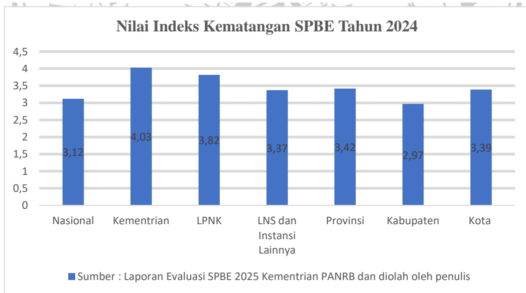
Grafik 1.2 Nilai Indeks Kematangan SPBE

Jika dilihat dari grafik diatas Nilai Indeks Kematangan SPBE tahun 2024 Kabupaten ada pada angka terendah dari instansi pemerintah lainnya. Angka 2,97 masih termasuk pada kategori “Baik”. Penerapan SPBE di Kabupaten perlu diperhatikan lagi. Beberapa tantangan yang menyebabkan rendahnya nilai indeks kematangan SPBE di Kabupaten yaitu, minimnya sumber daya manusia