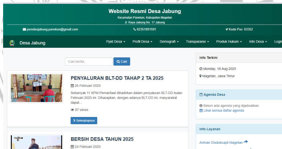
Gambar 1. 1 Beranda Website Desa Jabung

Di Kecamatan Panekan Kabupaten Magetan, Sistem Pemerintahan Berbasis Elektronik diterapkan dalam dua aspek yaitu pelayanan publik dan layanan administrasi dalam pemerintahan. Website desa adalah salah satu layanan administrasi pemerintahan dengan digitalisasi yang ditujukan untuk memperkuat desa untuk mencapai pemerintahan desa yang akuntabel dan terbuka (Hutagalung et al., 2020).