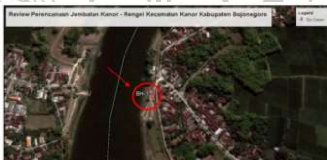
Gambar 1. 1 Lokasi pembangunan jembatan kanor

Dalam perencanaan struktur bawah jembatan, berbagai jenis pondasi dapat dipertimbangkan, salah satunya adalah pondasi tiang pancang. Jenis pondasi ini dipasang dengan cara dipancang menggunakan hammer hingga mencapai kedalaman tertentu. Pemilihan pondasi tiang pancang didasarkan pada keunggulannya yang mampu menyesuaikan dengan beragam kondisi tanah, termasuk pada area yang berair maupun berpasir. Lokasi pembangunan Jembatan Kanor serta tampak memanjangnya ditunjukkan pada Gambar 1.2.