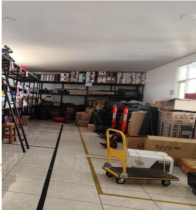
Gambar 1.1 Foto Tata Letak Gudang Juragan 99 Trans

Pada Gambar 1.1 dapat dilihat bahwa terdapat barang berukuran besar yang berada diluar rak sehingga akses jalan yang berada di gudang Juragan 99 Trans terjadi penyempitan. Pengelompokan sparepart berdasarkan kategori yang benar juga belum dilakukan, yang menyebabkan proses pengambilan barang menjadi tidak efektif dan memakan waktu lebih lama (3). Para pekerja sering kali mengambil dan mengembalikan barang tanpa mengikuti aturan penempatan yang jelas, sehingga menimbulkan kebingungan dan meningkatkan risiko kerusakan barang.