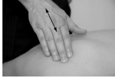
Gambar 2.2 Flat palpation