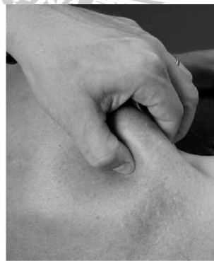
Gambar 2.3 Pincer palpation

Pincer palpation merupakan pemeriksaan yang dilakukan dengan cara menjepit otot dengan teknik palpasi. Otot dijepit atau dilakukan penekanan untuk nyeri lokal (titik paku). Dan memperoleh respon nyeri lokal yang menandakan adanya myofascial pain syndrome (Dommerholt & Huijbregts, 2011).