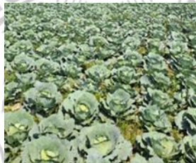
Gambar 2.3 Kubis ( Brassica oleracea L.)