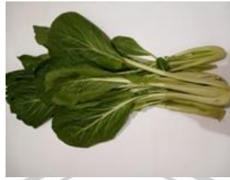
Gambar 2.2 Sawi Hijau ( Brassica rappa var. parachinensis L.)