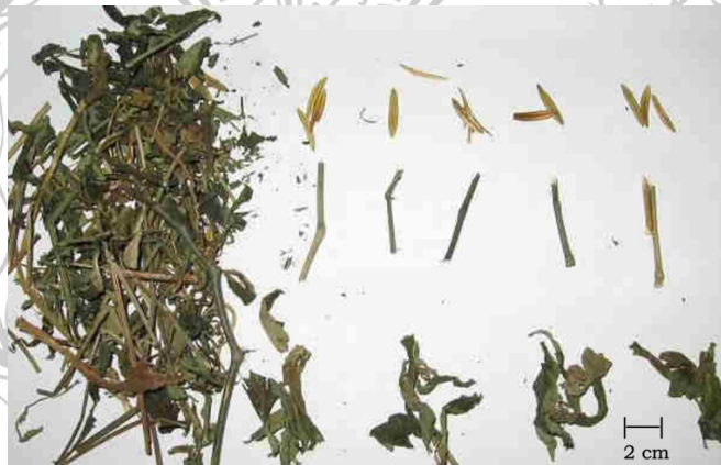
Gambar 2. 1 Herba Sambiloto.

Herba sambiloto dikenal juga dengan nama ilmiah Andrographis paniculate (Burm.f.) Nees., suku Acanthaceae yang mengandung andrografolid tidak kurang dari 0,50% (Badan Pengawas Obat dan Makanan, 2017). Pemerian berupa batang, daun, bunga, buah dan biji, batang tidak berambut, persegi empat, daun berupa lembaran, melekuk bentuk lonjong sampai lanset, rapuh, tipis, tidak berambut, pangkal daun runcing, tepi rata, ujung runcing sampai meruncing, tipe buah kotak, bentuk jorong, pangkal dan ujung panjang, terdapat sudut-sudut buah, kadang-kadang pevah secara membujur, biji agak keras dengan tonjolan; daun berwarna hijau tua atau hijau kecoklatan, buah hijau tua hingga hijau kecoklatan, biji cokelat muda; tidak berbau; rasa sangat pahit (Badan Pengawas Obat dan Makanan, 2017).