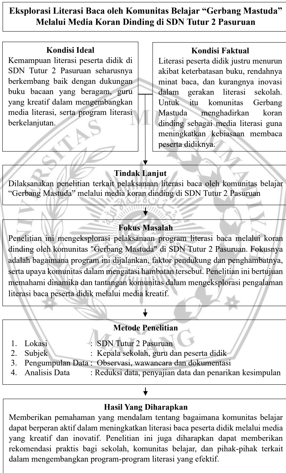
Gambar 2. 3 Kerangka Pikir