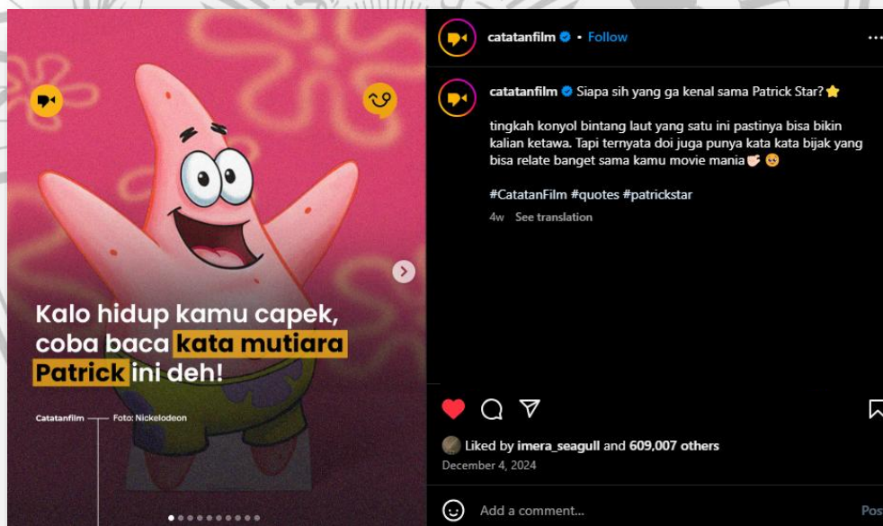
Gambar 2. 2: Akun @catatanfilm