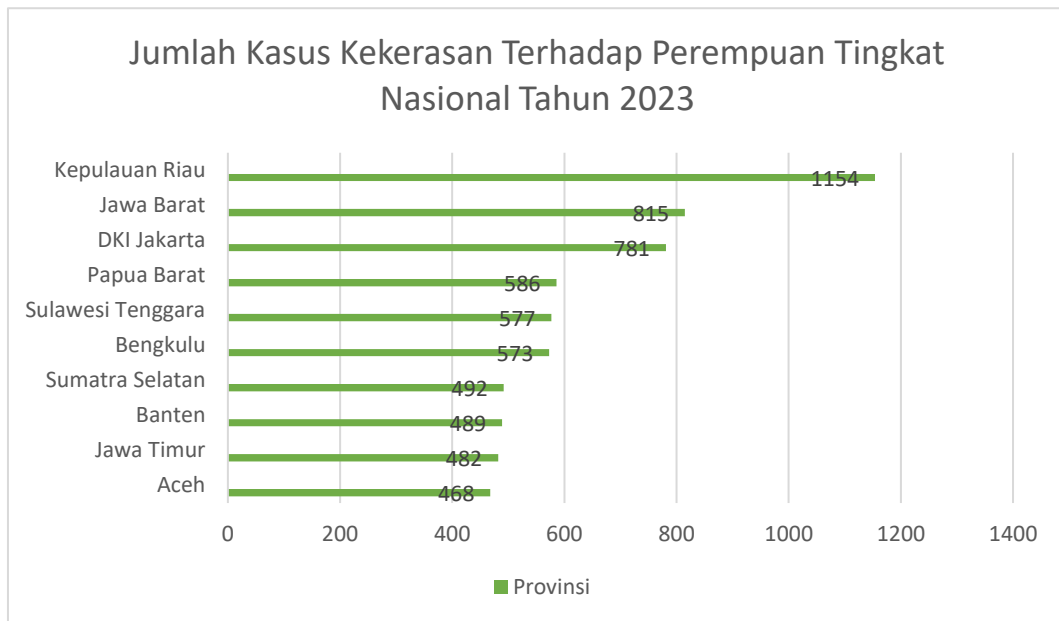
Diagram 1.1 Jumlah Kasus Kekerasan Terhadap Perempuan Tingkat Nasional Tahun 2023