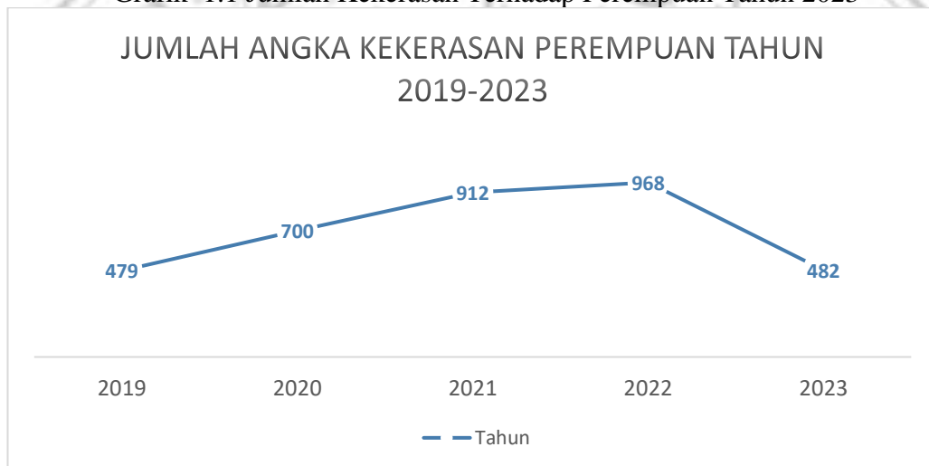
Grafik 1.1 Jumlah Kekerasan Terhadap Perempuan Tahun 2023

Lalu, kekerasan psikis terjadi ketika seseorang melakukan pengancaman atau mengintimidasi perempuan dengan mengisolasi dari keluarga maupun dari teman (Saenab, 2021). Kekerasan emosional tentu berkaitan atau terhubung dengan kondisi psikis korban. Hal tersebut dimulai dengan perkataan dan perbuatan yang membuat perempuan itu terlihat bodoh dan merasa tidak berharga. Lalu, memprovokasi dengan menyalahkan semua masalah keluarga yang terjadi disebabkan oleh korban dan mempermalukan di depan orang lain. Berikut jumlah kekerasan di Provinsi Jawa Timur!