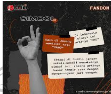
gambar 2. 1 macam rupa bentuk simbol

tidak akan bisa tersampaikan tanpa adanya penanda sebagai bentuk realitasnya. Jika disederhanakan dengan contoh misalnya seperti gambar di bawah ini: