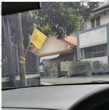
gambar 2. 3. Gambar bendera kuning

Contoh umum penanda dan petanda lain yang umum di masyarakat yang lain adalah bendera kuning tanda kematian atau berduka, walaupun ada juga yang menggunakan bendera putih dengan tanda salib hijau namun sebagi besar memakai bendera kuning sebagi tanda kematian, tanda kematian bendera kunng di percaya adalah turunan dari budaya penjajahan belanda dahulu