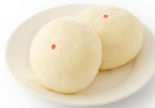
gambar 2. 4. Gambar bakpau

adapun contoh lainya dalam konteks kuliner adalah titik warna di bakpau, bakpau yang notabene adalah makanan khas dari Tionghoa yang memiliki bentuk bundar dengan warna putih biasanya mempunyai sebuah titik warna di tengahnya sebagai tanda untuk isian di dalamnya.