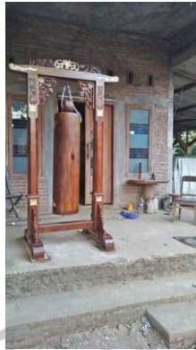
gambar 2. 2. Gambar kentongan

Adapun tempat kentongan ini biasanya terdapat di pos kamling atau di tempat yang mudah di jangkau untuk di jadikan titik kumpul warga.