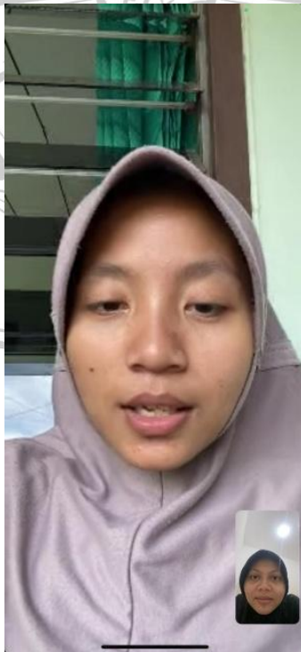
Screen Capture Wawancara Yessy