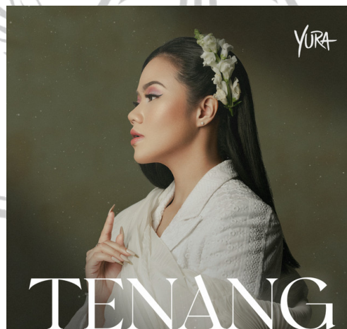
Gambar 1.2 Official Video Yang Ditonton Lebih Dari Tiga Juta Kali

beberapa detik video yang terselamatkan. Dalam Short Movie “Tenang” sendiri berbicara tentang kegelisahan, perenungan, dan pencarian makna hidup yang damai. Dalam versi visualnya, pesan tersebut diperkuat lewat narasi kehilangan dan upaya berdamai dengan rasa duka. Lewat lagu “ Tenang ” dan film pendek ini, ia mengajak pendengar untuk berhenti sejenak, merenung, dan menemukan kedamaian dari dalam diri.