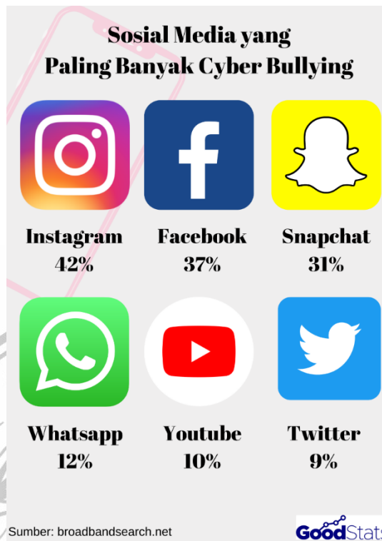
GAMBAR 1. 1 INSTAGRAM MENJADI MEDIA SOSIAL TERTINGGI CYBERBULLYING (SOURCE : BROADBAND SEARCH)

Dari data diatas, Instagram menjadi platform media sosial dengan cyberbullying tertinggi dengan 42% berdasarkan riset dari Broadband search . Setiap pengguna internet seharusnya sudah memiliki pengetahuan tentang cyberbullying dan pengetahuan tentang internet, agar semua pengguna dapat menghindari tindakan cyberbullying tersebut. Kasus cyberbullying saat ini seperti sudah dianggap sebagai hal yang biasa oleh sebagian masyarakat karena fenomena tersebut sering dijumpai dalam media sosial, khususnya Instagram. Fitur penyaringan komentar di Instagram seolah tidak dapat membendung berbagai komentar netizen yang mengarah ke dalam hal negatif. Selain itu, pelaku cyberbullying dengan bebasnya melontarkan kata-kata yang menyinggung dan semaunya melakukan penghinaan tanpa merasa bersalah.