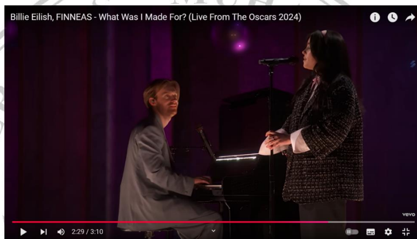
Gambar 2.3 “What Was I Made For?” Billie Eilish dan FINNEAS Live

Billie Eilish merupakan penyanyi dan penulis lagu asal Amerika Serikat kelahiran 2001, yang debut pada tahun 2015 dengan lagu berjudul “Ocean Eyes”. Lirik-lirik dalam lagunya sering kali berani, introspeksi, dan kritis terhadap berbagai norma sosial, termasuk patriarki. Perjalanan karirnya dimulai dengan lagu “Ocean Eyes” yang diunggah dalam platform SoundCloud di tahun 2015. Lagu tersebut membuat banyak perhatian atau viral, termasuk produser yang bernama Finneas O’Connell, yang juga merupakan kakak dari Billie Eilish. Semenjak itu, Billie dan Finneas bekerja sama untuk menghasilkan musik dengan gaya yang unik, dan genre seperti elemen elektronik dan pop alternatif.