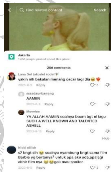
Gambar 1.1 Komentar Netizen

Yang kemudian ditanggapi oleh netizen di kolom komentar bahwa lagu “What Was I Made For?” pantas untuk menang di Oscar dan cocok dengan film “Barbie” yang bertanya untuk apa aku ada?