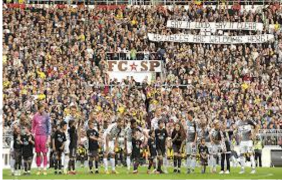
Gambar 2.5 Pertandingan Refugees Welcome