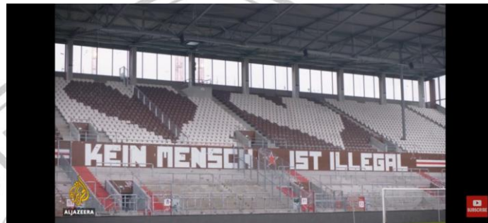
Gambar 2.3 Pesan pada salah satu tribun Millerntor

pengungsi, dan keterlibatan mereka dalam program “ viva con aqua ” yang bertujuan menyediakan air bersih untuk negara-negara berkembang. 64