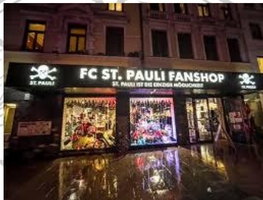
Gambar 2.4 FC St. Pauli Fanshop