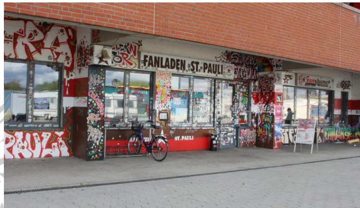
Gambar 2.1 Fanladen, Millerntor.

yakini. Mereka biasanya terlibat dengan komunitas-komunitas yang berasal dari subkultur alternatif seperti punk . 37