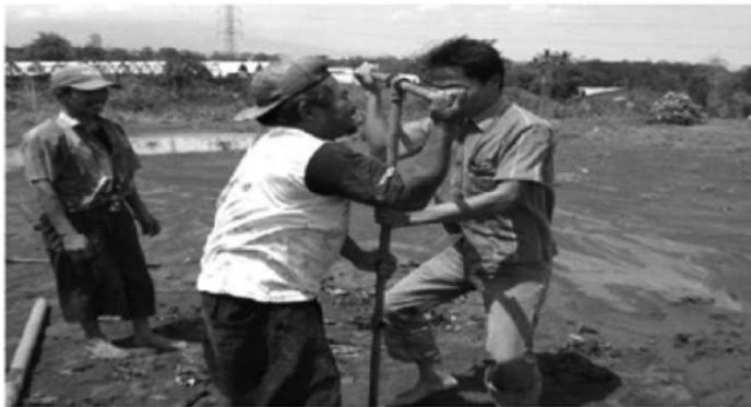
Gambar 1. Titik Pengeboran Pengambilan Sampel pada Sel IV

Titik pengeboran untuk pengambilan sampel di TPASupit Urang, tepatnya di sel IV ini dapat dilihat pada gambar berikut: