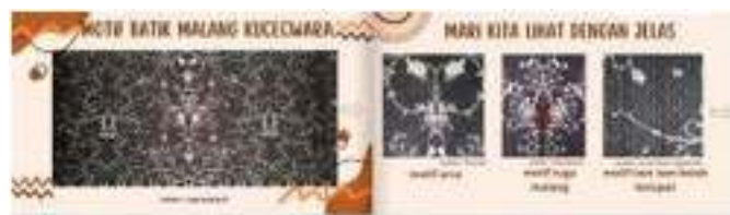
Gambar 1.7 Slide kesepuluh dan kesebelas

Didalam slide kesepuluh dan kesebelas menampilkan motif dari batik malang kucecwara dan diperjelas pada slide berikutnya.