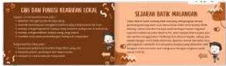
Gambar 1.5 Slide Keenam dan ketujuh

Didalam slide keenam dan ketujuh disambung dengan ciri dan fungsi kearifan lokal dan sejarah batik malangan.