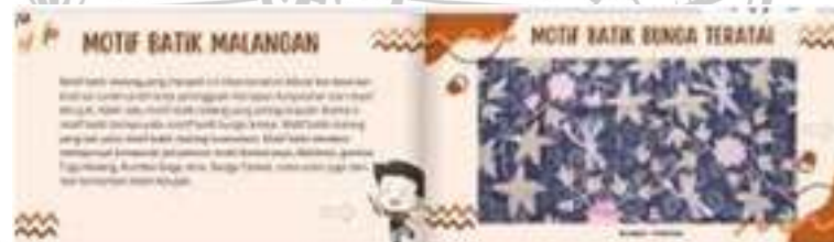
Gambar 1.6 Slide Kedelapan dan kesembilan

Didalam slide kedelapan dan kesembilan dilanjutkan dengan pengertian dari motif batik malangan serta gambar dari motif batik bunga Teratai khas malang.