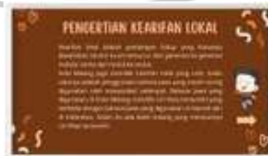
Gambar 1.4 Slide Kelima Sumber : Dokumen Pribadi

Dalam slide kelima dijelaskan pengetahuan secara garis besar tentang kearifan lokal yang bekesinambungan dengan budaya batik khas malang.