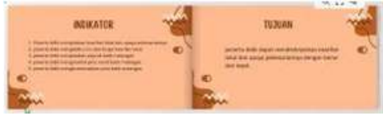
Gambar 1.2 Slide Kedua dan ketiga