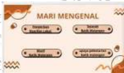
Gambar 1.3 Slide Keempat

Untuk slide keempat akan ditampilkan dengan 4 urutan yang dimulai dari pengertian, sejarah, motif, lalu upaya pelestarian batik malang.