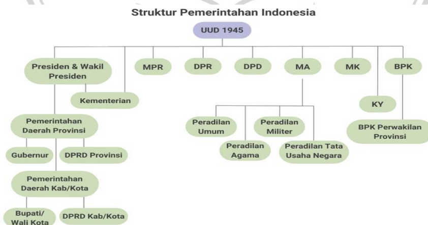
Gambar 2 2 Struktur Pemerintahan Indonesia

Menjalankan roda pemerintahan, tentunya harus dilakukan secara sistematis, hal ini dimaksudkan agar penyelenggaraan negara dalam memberikan kebijakan terstruktur dan terukur. Sebelum lebih mendalam mengkaji masalah kebijakan negara, alangkah lebih baiknya penulis memaparkan terlebih dahulu struktur pemerintahan di Indonesia, sebagaimana table di diagram ini (Issha Harruma 2022):