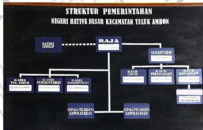
Gambar 3.2 Struktur Pemerintahan Negeri Hative Besar

Tahun 2014, serta aturan-aturan lain terkait dengan ini. Namun, mengingat Negeri Hative Besar sebagai desa adat/negeri sehingga ada unsur adat yang dikembangkan salah satunya adalah yang dikenal sebagai badan saniri yang menjadi pengisi lain dan dari kepemimpinan di negeri. Sehingga kepemimpinan adat memiliki struktur pemerintahannya sendiri, termasuk Negeri Hative Besar. Berikut merupakan struktur pemerintahan Negeri Hative Besar: