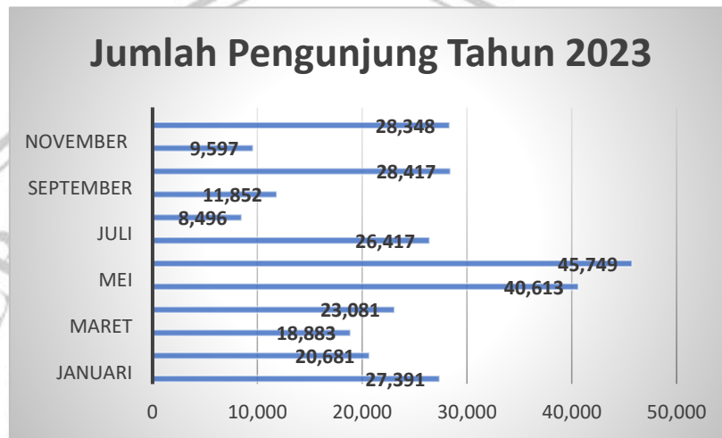
Diagram 1. 1 Data jumlah pengunjung tahun 2023

yang bisa menjadi tempat edukasi, playgroup dan memberikan pengalaman yang menarik. Meskipun TKL Ecopark masih menjadi tempat wisata populer di Kota Magelang, terdapat masalah dengan jumlah pengunjung yang menurun setiap tahunnya.