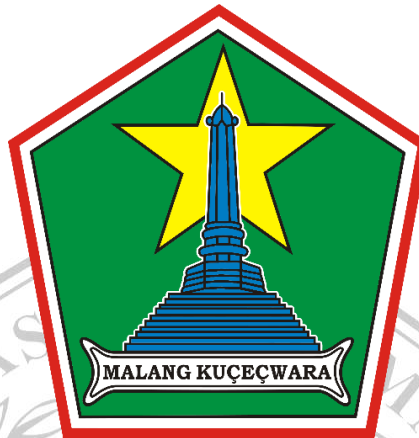
Gambar 3.2 : Lambang Kota Malang

menjadi bagian dari kesatuan wilayah yang disebut sebagai Malang Raya (“Kota Malang,” n.d.).