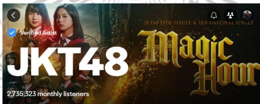
Gambar 2.

Salah satu definisi fanatisme adalah pengabdian yang tidak terkendali, tidak terkendali, dan terkadang disertai kekerasan terhadap suatu tujuan atau ideologi tertentu. Definisi lainnya adalah obsesi terhadap tujuan atau ideologi tertentu. Tingkat fanatisme seseorang mungkin meningkat hingga ke tingkat merasionalisasikan tindakan mereka (Robles, 2013). Menurut (Thorne & Bruner, 2006), seseorang yang fanatik adalah seseorang yang menunjukkan perilaku berlebihan yang mungkin dianggap orang lain sebagai disfungsi atau subversif karena antusiasme atau minatnya yang kuat terhadap sesuatu seperti orang, organisasi, tren, karya seni, atau ide tertentu. Fanatisme sendiri lahir dari perasaan seseorang ataupun kelompok yang pada dasarnya menggemari sesuatu atau mengidolakan seseorang. Dari perasaan senang tersebut berkembang menjadi perasaan yang lebih ekstrim yang terkadang dapat merugikan baik diri sendiri maupun orang lain.