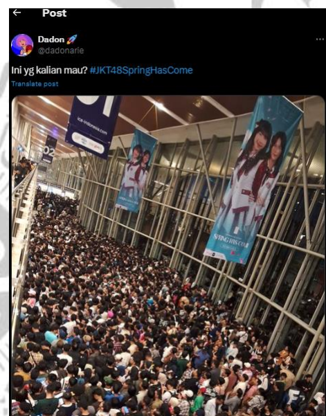
Gambar 3 dan 4.

Dari naiknya jumlah fans sendiri membuat Fans JKT48 sendiri menjadi semakin beragam dan bermacam-macam. Sejak Oktober 2020, ada sebuah akun twitter/X yang bernama Polisi Idol. Akun Polisi Idol ini seringkali mengeluarkan cuitan yang isinya mengkritik JKT48 baik manajemen, member, hingga sesama fans. Akun X Polisi Idol ini dianggap sebagai oposisi dalam dunia idoling JKT48. Namun tidak semua orang mendukung apa yang dilakukan Polisi Idol ini. Sebagian fans tidak suka dengan Polisi Idol dikarenakan terkadang kritikan yang diberikan terlalu keras dan bahkan dianggap terlalu personal kepada member tertentu. Akun X Polisi Idol sendiri bahkan di block oleh beberapa