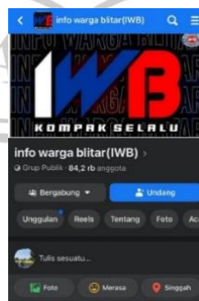
Gambar 1.1.2 Grup halaman facebook utama

Dengan banyaknya presentase dibuktikan bahwa masyarakat masih bergantung dengan media sosial untuk kebutuhan hidupnya. Dengan pernyataan tersebut masyarakat banyak menggunakan Facebook maka peluang untuk membuat grup Facebook dapat berkembang lebih pesat. Munculnya fenomena Grup Facebook tak lepas dari media sosial. Menurut (Rhama Sandya pratama 2021 : 3) mengatakan bahwa Media sosial adalah rangkaian aplikasi berbasis web yang didasarkan pada filosofi dan teknologi yang memungkinkan para pengguna membuat dan mendistribusikan konten. Facebook, Instagram, Twitter, paling banyak digunakan. Menurut (Watie 2016 : 70) mengatakan bahwa dengan begitu banyaknya media sosial saat ini, komunikasi tidak ada lagi hambatan dan batasannya, seperti jarak, waktu dan ruang. Media sosial ini dapat menghilangkan strata tingkat sosial yang sudah melekat pada setiap pemikiran masyarakat, dengan adanya media sosial saat ini aktivitas komunikasi dapat dilakukan dimana saja, kapanpun dan tidak harus bertatap muka. Dengan adanya perkembangan internet membuat komunikasi antar umat manusia menjadi lebih cepat dan luas. Salah satunya yaitu grup "Info Warga Blitar (IWB)" yang berlokasi di Blitar yang mencakup Kota dan Kabupaten. Grup ini dibuatkan untuk memenuhi kebutuhan dasar informasi sesama anggota dalam bertukar informasi, curhat, jual beli, lowongan pekerjaan dll. Oleh karena itu peneliti melakukan hasil pra interview penelitian dengan sebagai berikut :