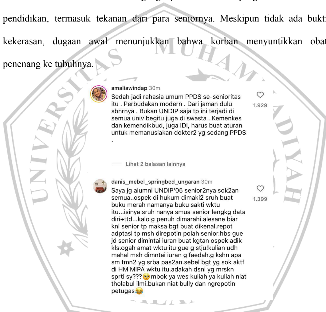
Gambar 1.2: Komentar di @undip.official (15/08/2025)

Pendidikan Dokter Spesialis (PPDS) Anestesi di Universitas Diponegoro (Undip), ditemukan meninggal dunia. Seorang teman dekatnya mengatakan kepadanya bahwa ia tidak bisa dihubungi sejak pagi. Korban ditemukan miring dengan wajah membiru saat tukang kunci membantu membuka pintu kamar. Polisi menemukan buku harian di mana dia mengungkapkan kesulitan yang dialami selama pendidikan, termasuk tekanan dari para seniornya. Meskipun tidak ada bukti kekerasan, dugaan awal menunjukkan bahwa korban menyuntikkan obat penenang ke tubuhnya.