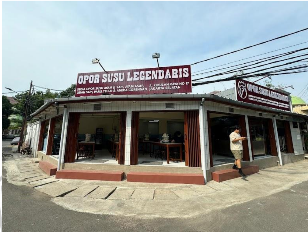
Gambar 4. 12 Opor Susu Legendaris milik Jonathan Liandi

biasa ia tekuni seperti biasanya. Melalui pamor namanya yang sudah cukup dikenal dan juga promosi yang bisa ia lakukan Melalui akun sosial medianya, membuat Opor Susu Legendaris dapat menjadi salah satu bisnis yang menjanjikan.