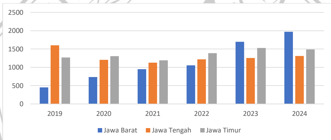
Grafik 1.1 Angka Kekerasan di Pulau Jawa

Berlandaskan pada data Kementerian Pemberdayaan Perempuan dan Perlindungan Anak menunjukkan kasus kekerasan pada anak di Pulau Jawa mengalami peningkatan selama 5 (lima) tahun terakhir, terutama di Jawa Timur.