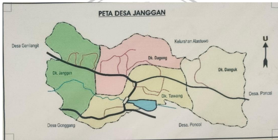
Gambar 3.3 Peta Desa Janggan