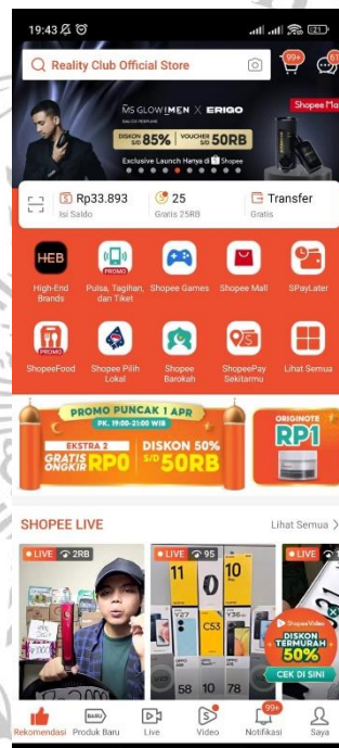
Gambar 1.3 Tampilan Shopee pada Handphone

untuk mempermudah penjual dan pembeli untuk saling berinteraksi, sehingga banyak konsumen yang tertarik menggunakan aplikasi Shopee. 29 Dengan alasan-alasan tersebut maka tak heran bahwa shopee menjadi e-commerce nomer satu di indonesia sebagai e-commerce yang paling banyak dikunjungi. dengan mudah dan banyak fitur membuat shopee kian unggul dibandingkan e-commerce lainnya.