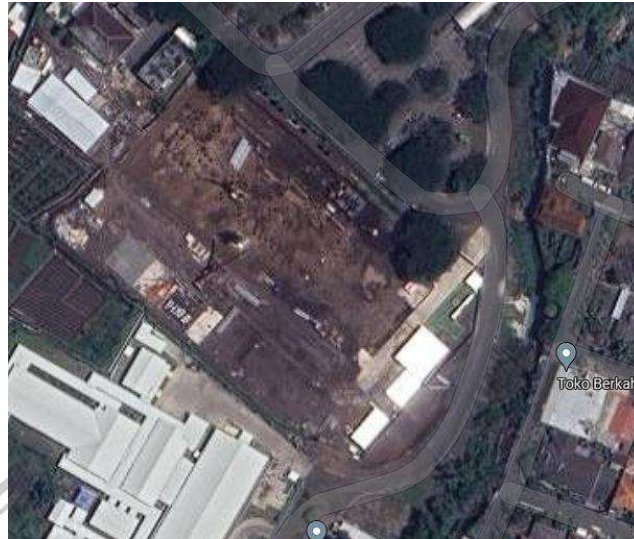
Gambar 3. 1 Lokasi Pembangunan