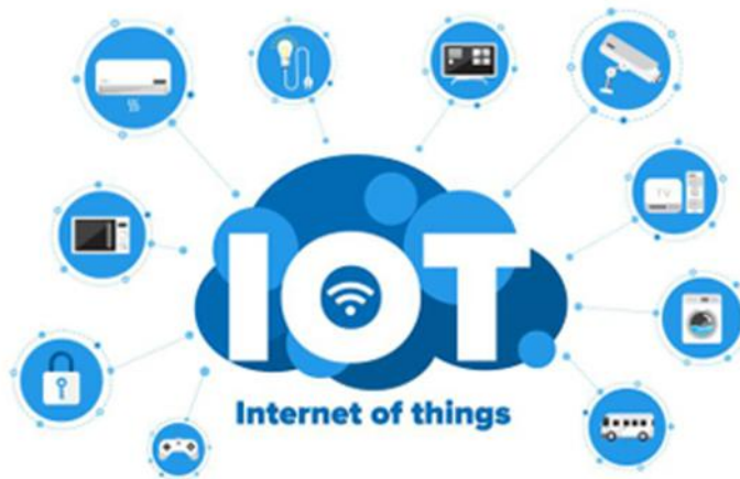
Gambar 2.1 Internet of Things

Internet of Things (IoT) adalah konsep di mana objek fisik, perangkat, atau sistem terhubung ke internet, saling berkomunikasi, mengumpulkan data, dan bertindak berdasarkan informasi yang diterima. Objek dalam IoT mencakup perangkat elektronik, kendaraan, sensor, rumah pintar, alat kesehatan, dan lainnya, dengan tujuan utama meningkatkan efisiensi, keamanan, dan kenyamanan melalui konektivitas dan pemanfaatan data[18].