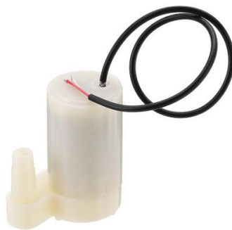
Gambar 2.5. Water Pump

Water pump atau pompa air adalah perangkat yang digunakan untuk