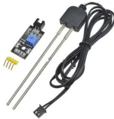
Gambar 2.3. Soil Moisture Hygrometer

Sensor Soil Moisture Hygrometer adalah perangkat yang digunakan untuk mengukur tingkat kelembapan tanah secara real-time. Sensor ini bekerja dengan mendeteksi perubahan konduktivitas listrik di tanah, di mana tingkat kelembapan yang lebih tinggi akan meningkatkan konduktivitas tersebut. Data yang dihasilkan oleh sensor ini akan dikirim ke mikrokontroler untuk diproses dan dianalisis. Penggunaan sensor ini sangat bermanfaat dalam sistem irigasi otomatis, karena memungkinkan penyesuaian jumlah air yang diberikan berdasarkan kebutuhan tanaman, sehingga meningkatkan efisiensi penggunaan air. Sensor ini memiliki dua pin probe logam yang ditanamkan ke dalam tanah untuk mendeteksi kadar air, dan biasanya beroperasi pada tegangan 3,3V hingga 5V, sehingga kompatibel dengan mikrokontroler seperti ESP8266.